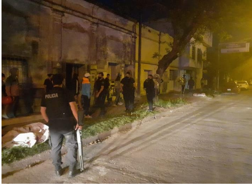
FOTOGRAFÍA 21: Control de eventos sociales en propiedad privada no permitidos.