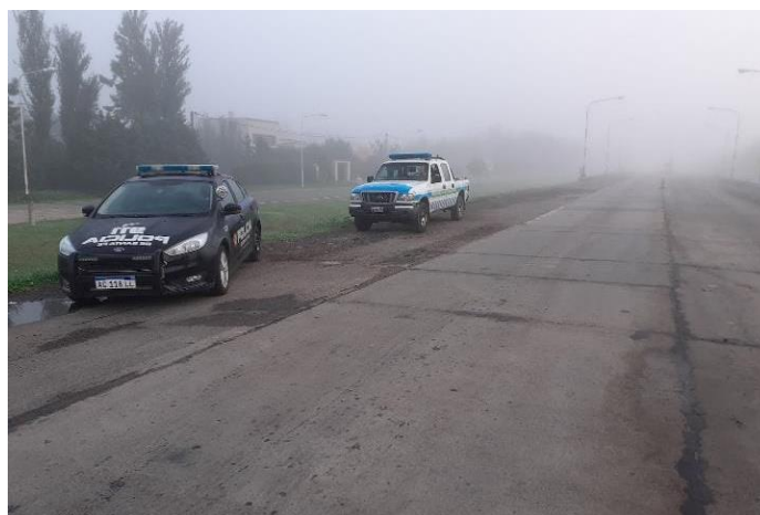
FOTOGRAFÍA 13: Control de permisos y motivos de circulación en Ruta N° 34 acceso sur, día con niebla.