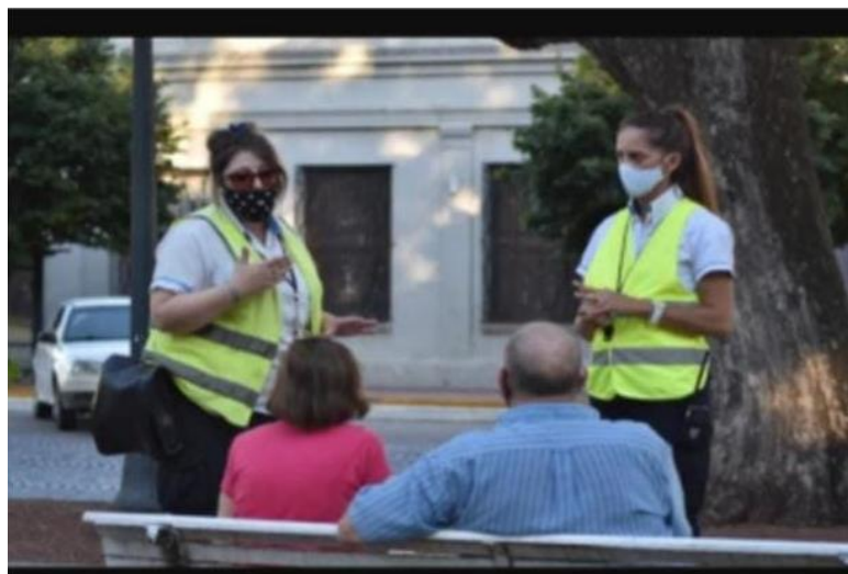
FOTOGRAFÍA 19: Control de uso de barbijos y distanciamiento en espacios públicos.