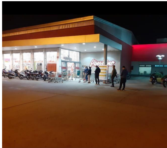
FOTOGRAFÍA 1: Control de distanciamiento en supermercado Pinguino.