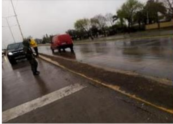
FOTOGRAFÍA 14: Control de permisos y motivos de circulación en Ruta N° 34 acceso sur, día lluvioso.