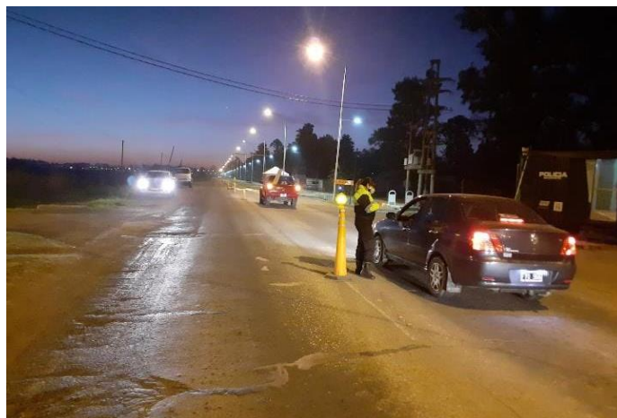
FOTOGRAFÍA 12: Control de permisos y motivos de circulación en Ruta N° 70 acceso este, horario nocturno.