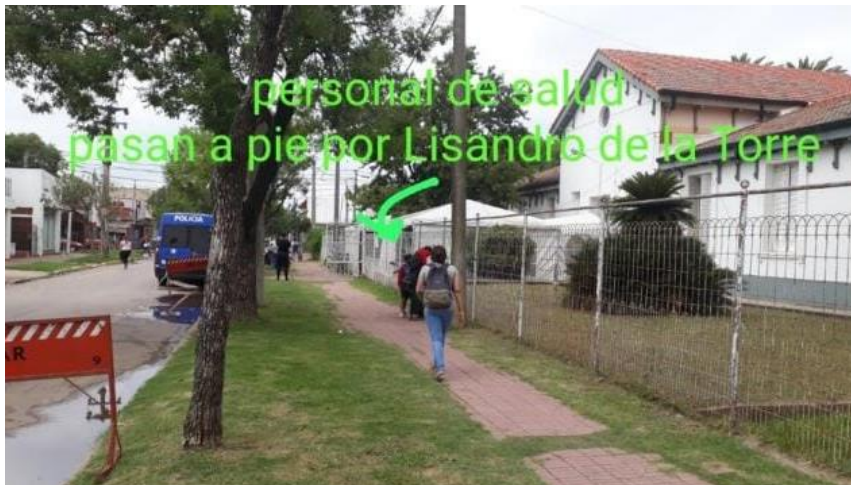
FOTOGRAFÍA 22: Ordenamiento de personas y tránsito para realización de hisopados y vacunado.