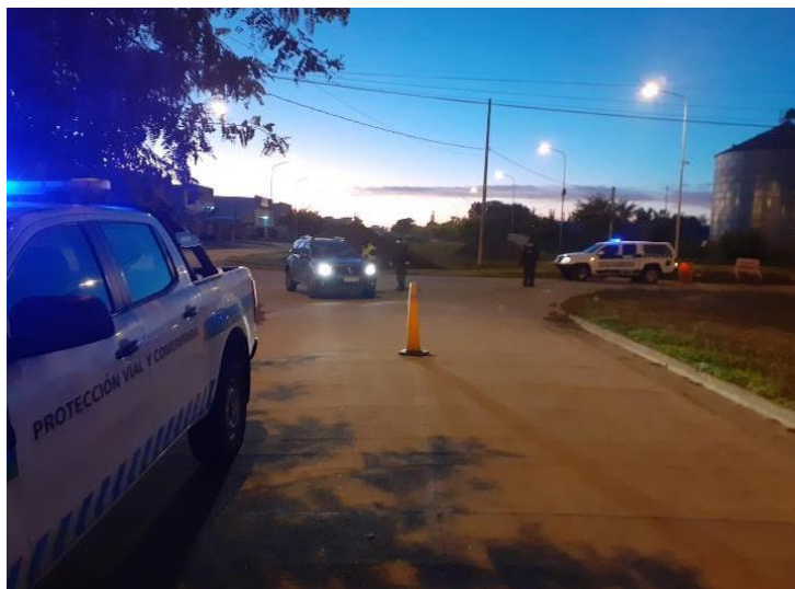
FOTOGRAFÍA 6: Control de permisos y motivos de circulación en PAER.