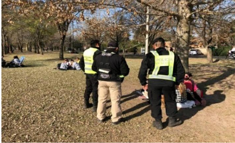
FOTOGRAFÍA 17: Control de uso de barbijos y distanciamiento en espacios públicos.