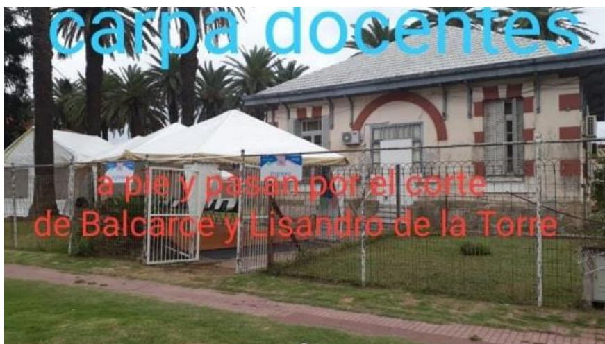
FOTOGRAFÍA 23: Ordenamiento de personas y tránsito para realización de hisopados y vacunado.