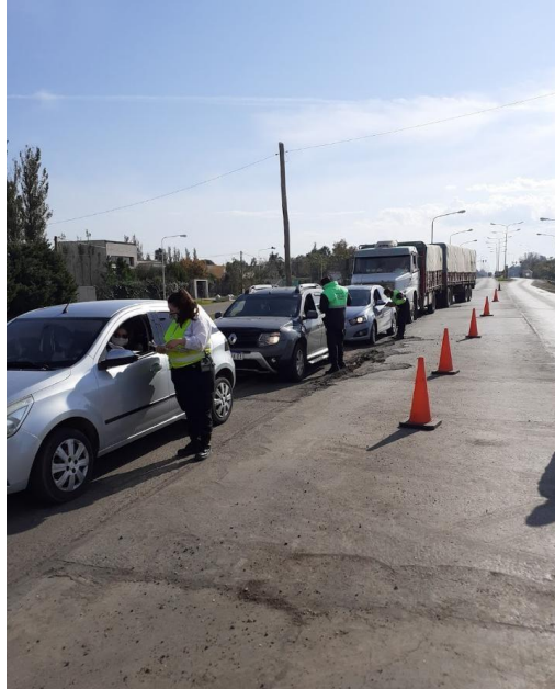
FOTOGRAFÍA 11: Control de permisos y motivos de circulación en Ruta N° 34 acceso sur, día soleado.