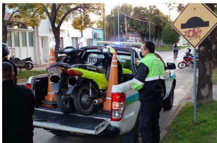
FOTOGRAFÍA 7: Retención de motovehículos por no justificar motivos de circulación.