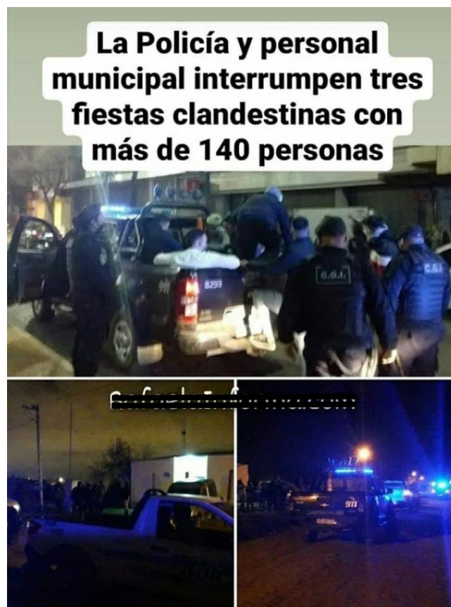
FOTOGRAFÍA 20: Control de eventos sociales en propiedad privada no permitidos.