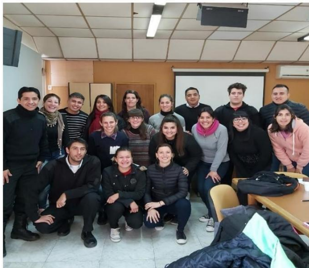
IMAGEN 1: Camada de inspectores incorporados en Julio de 2019.

Como objetivo nos planteamos dejar registro, siempre desde nuestra mirada y con nuestro aprendizaje, intentando no dejar en el olvido algo tan significativo. Esperando generar para un futuro herramientas y/o protocolos que nos permitan estar preparados para afrontar desafíos de esta magnitud.