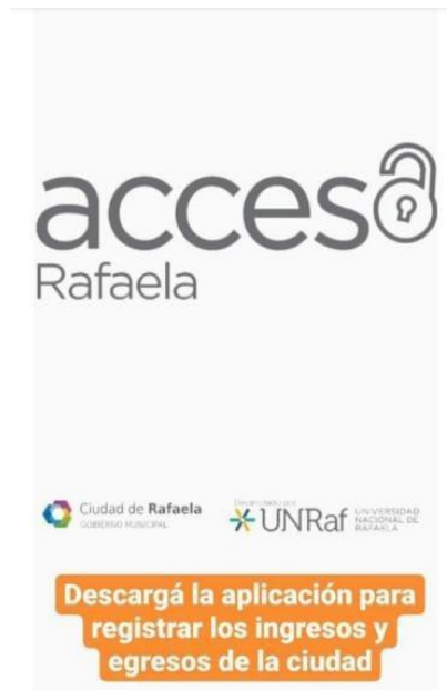
CAPTURA DE PANTALLA 1: Aplicación acceso Rafaela.