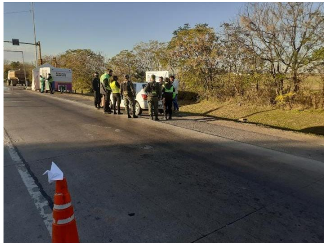
FOTOGRAFÍA 9: Control de permisos y motivos de circulación en Ruta N° 34 acceso sur.