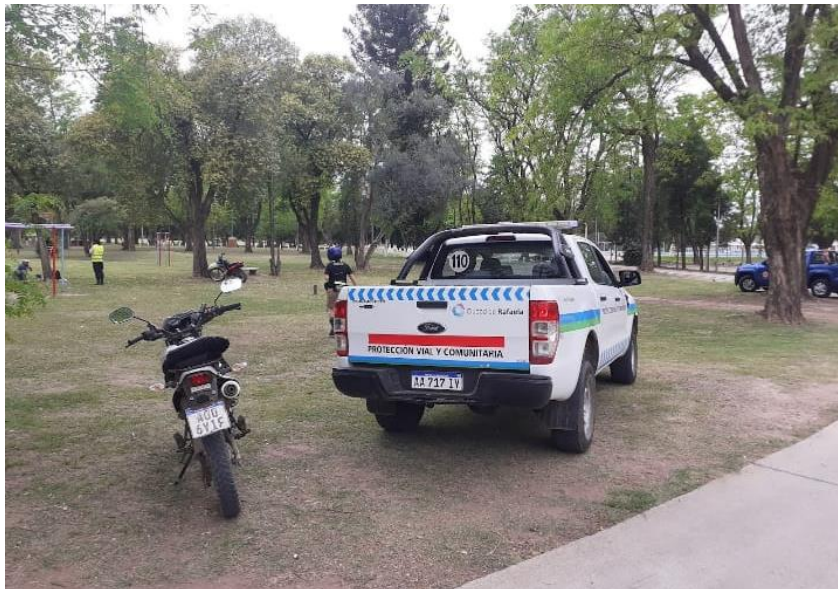
FOTOGRAFÍA 18: Control de uso de barbijos y distanciamiento en espacios públicos.