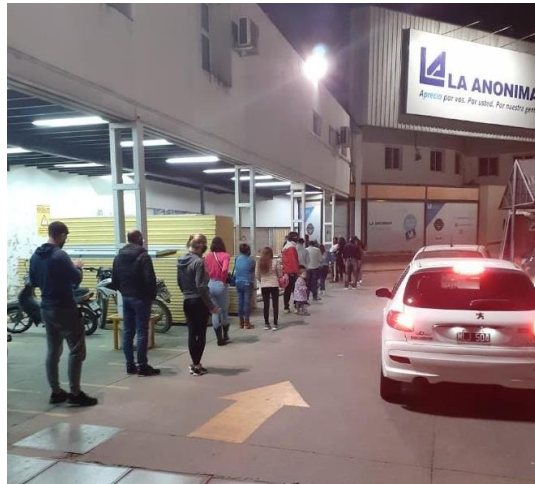
FOTOGRAFÍA 3: Control de distanciamiento en supermercado La Anónima.