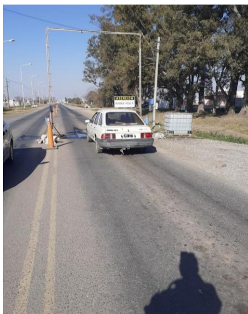
FOTOGRAFÍA 10: Control de permisos y motivos de circulación en Ruta N° 70 acceso oeste.