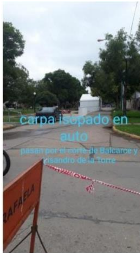
FOTOGRAFÍA 24: Ordenamiento de personas y tránsito para realización de hisopados y vacunado.