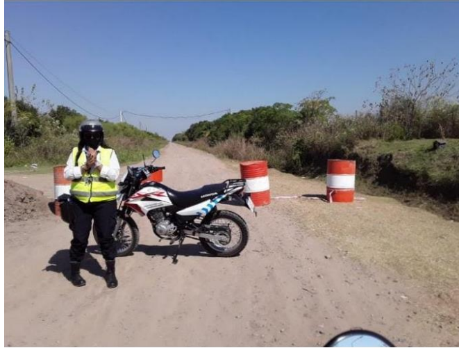
FOTOGRAFÍA 8: Control del no paso de personas por ingresos no autorizados.