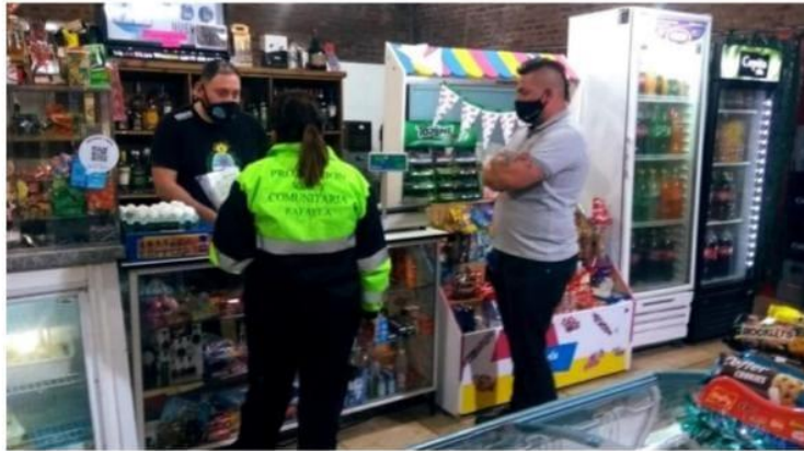
FOTOGRAFÍA 5: Control con brigada sanitaria en almacenes.